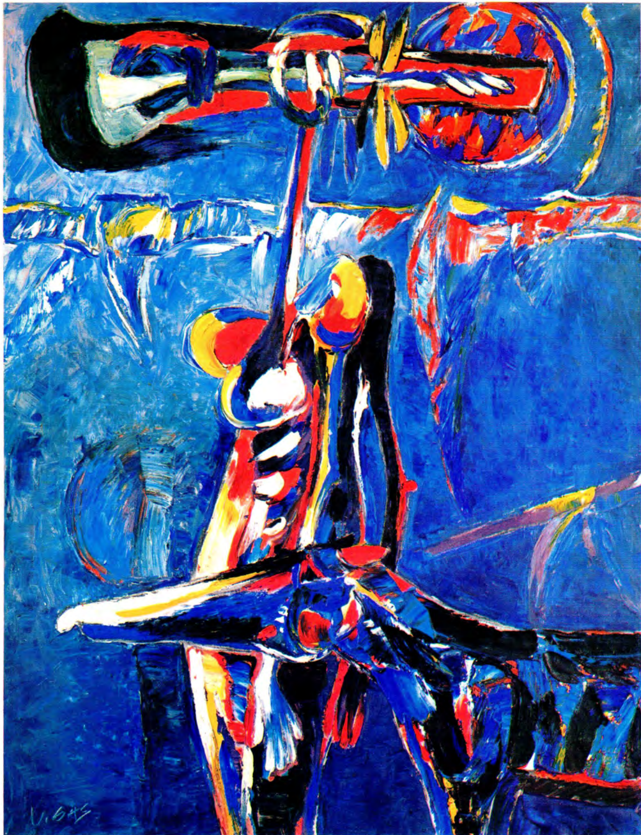
María Lionza, Señora del Tapir, 1967