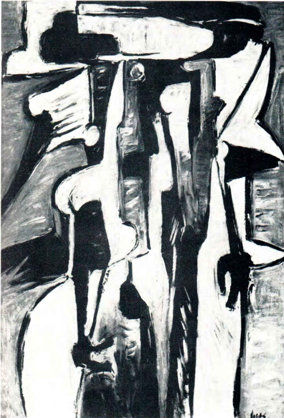
15. Agorífera gris, 1976