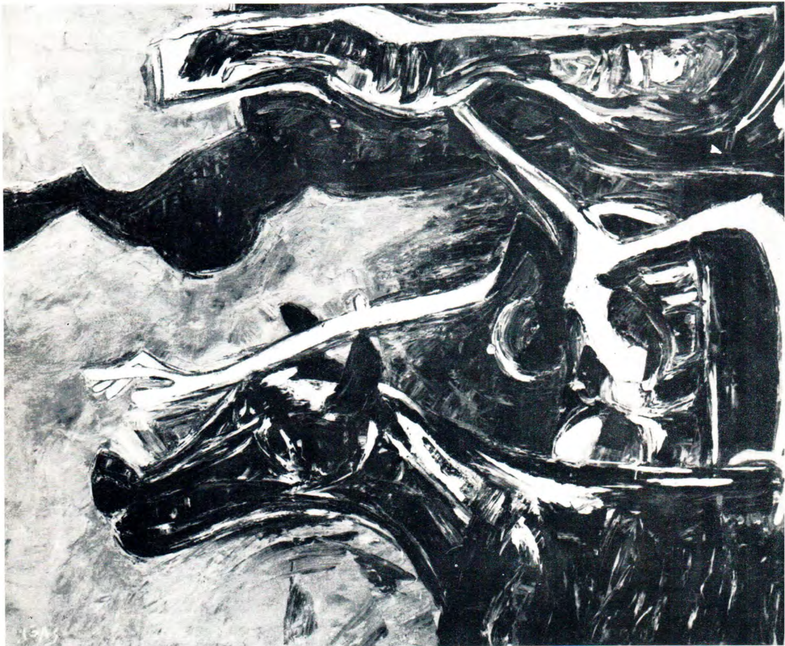
47. María Lionza, Señora de la Noche, 1967