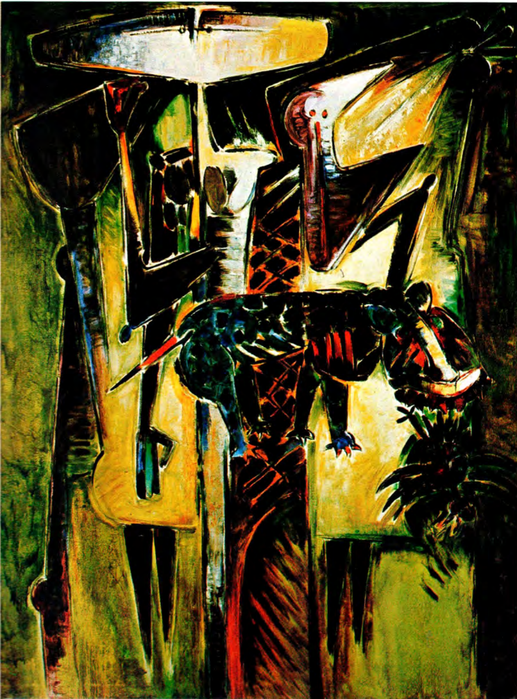
2. Animal de Costumbres, 1977