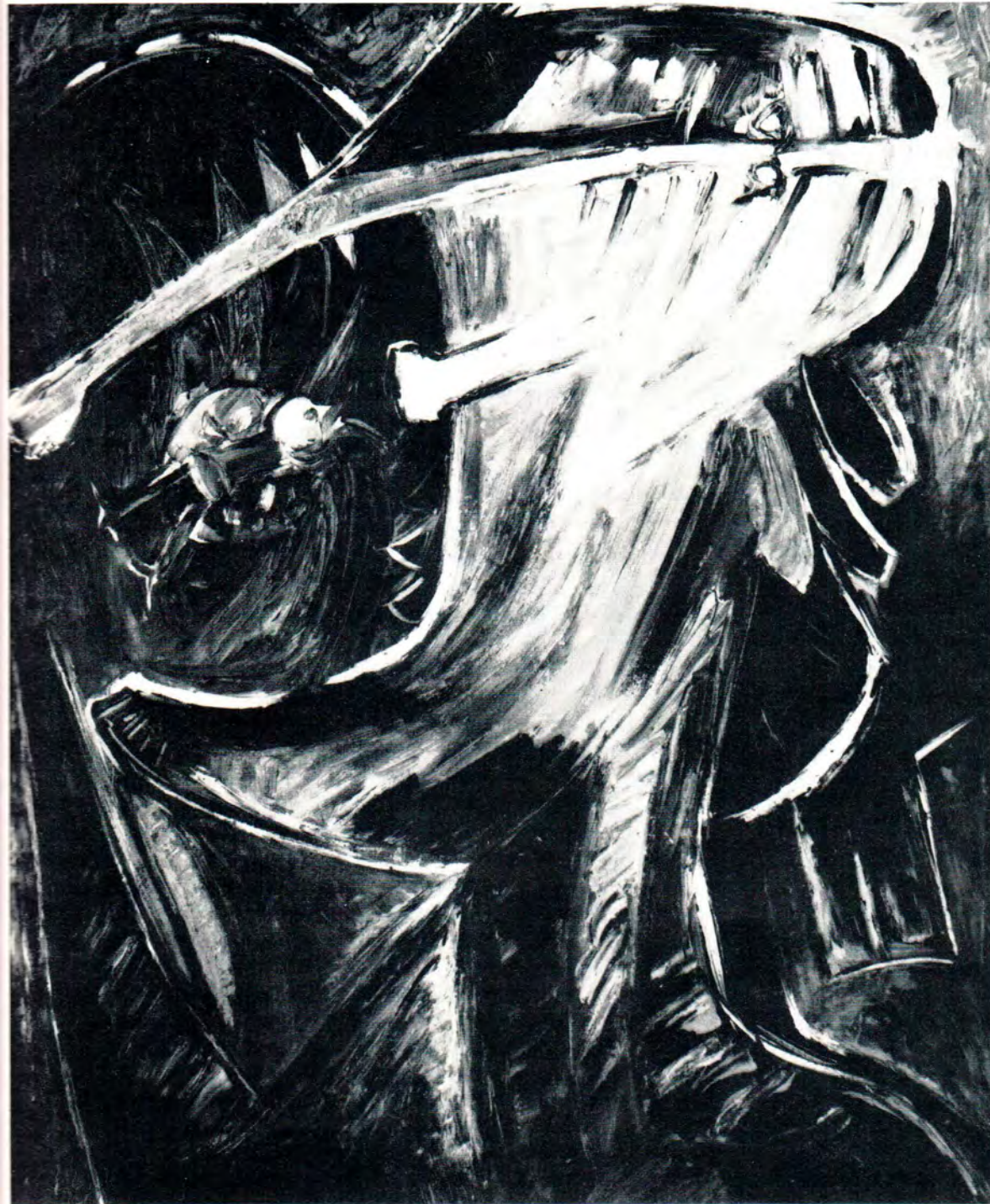
36. Atrapadora, 1975