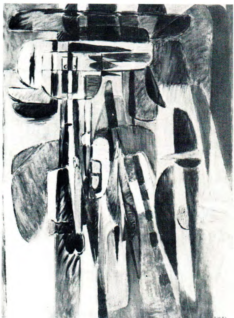
30 E. GAD