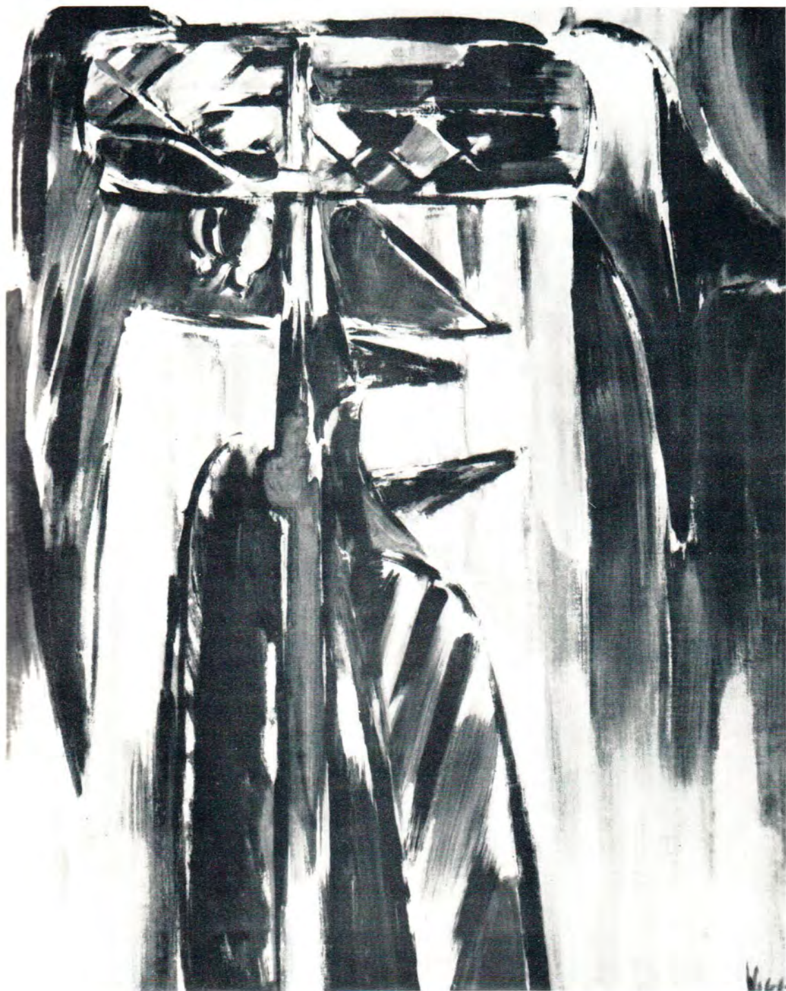
11. Dama Roja, 1977